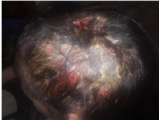
Figura 1: Placa gruesa, con costra amarillenta en su superficie, con secreción serohemática y dolor a la palpación, que asienta en región parietal izquierda, acompañado de otras lesiones de menor tamaño alrededor

Placa gruesa, con costra amarillenta en su superficie, de aproximadamente 5 x 3 cm, de bordes irregulares y límites netos, con secreción serohemática y dolor a la palpación, que asienta en región parietal izquierda, acompañado de otras lesiones de menor tamaño alrededor (Figura 1). En la región posterior a la placa se encuentra una formación nodular eritematosa de aproximadamente 3 cm de diámetro, fluctuante, con orificios en el centro con el signo de la espumadera presente (Figura 2). Adenopatías occipitales numerosas, dolorosas, móviles. Presencia de liendres abundantes. Se toma muestra para cultivo bacteriano y micológico.