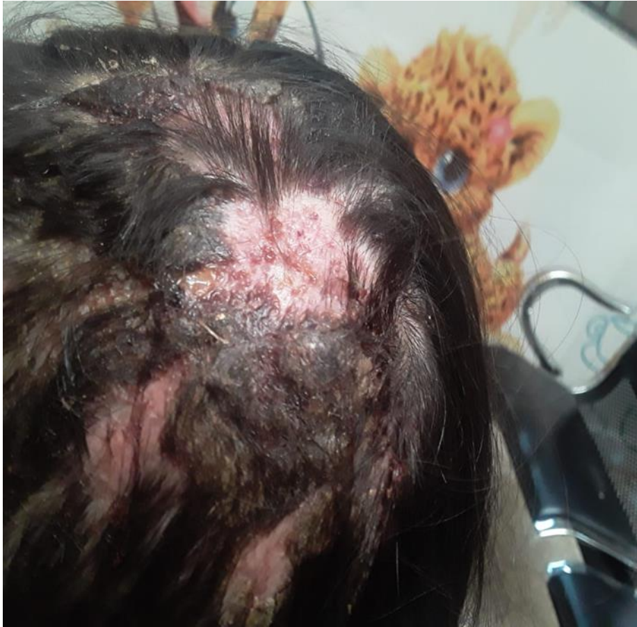
Figura 2: En la región posterior a la placa se encuentra una formación nodular eritematosa de aproximadamente 3 cm de diámetro, fluctuante, con orificios en el centro con el signo de la espumadera presente